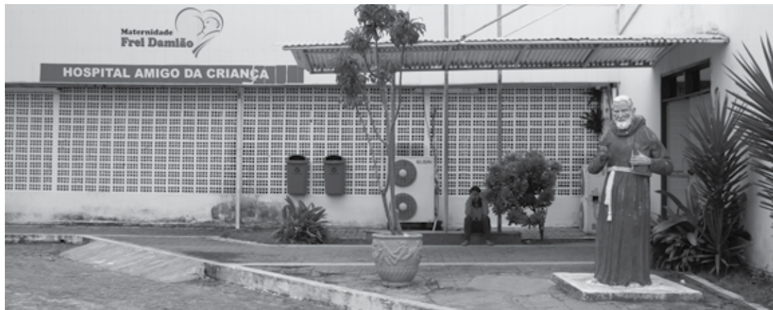
A Maternidade Frei Damião é referência para atendimento de mulheres grávidas suspeitas com covid-19

A Polícia Militar será acionada, caso seja necessário, para repelir a prática dos atos, identificar seus participantes e possíveis organizadores do evento, comunicando ao MPPB, no prazo de cinco dias, para fins de responsabilização civil e criminal dos mesmos.