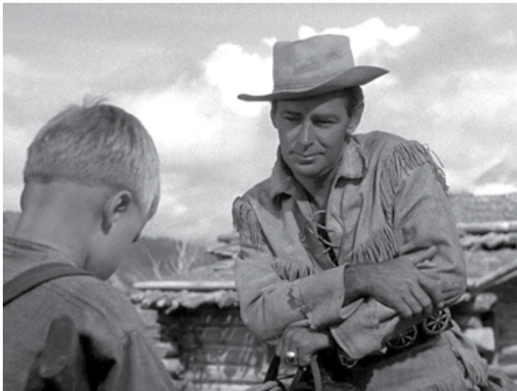
Allan Ladd é Shane no clássico 'Os Brutos Também Amam', filme de 1953

Nestes tempos de pandemia, estou trabalhando em regime de home office durante o dia, mas, à noite, tentando me livrar das más notícias de que os jornais da TV se ocupam em quase todo o seu tempo, resolvo – de vez em quando – antes de chegar o sono, assistir a alguma coisa interessante, como rever bons programas humorísticos – A Escolinha do Professor Raimundo é um deles – ou ver filmes antigos, quase todos de boa qualidade e dignos de serem vistos de novo.