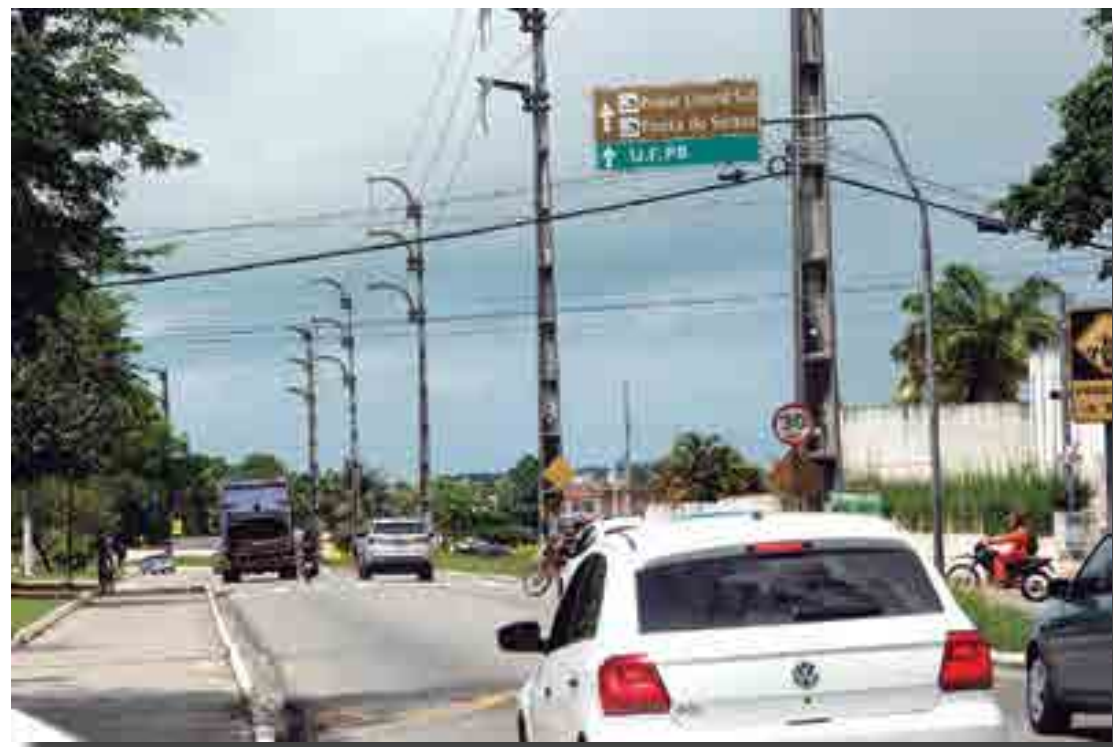
A Avenida Hilton Souto Maior é uma das principais vias de acesso ao José Américo e caminho para o Litoral Sul

Durante o período das prévias carnavalescas do Folia de Rua, os moradores se divertem muito com os desfiles de vários blocos de arrasto.