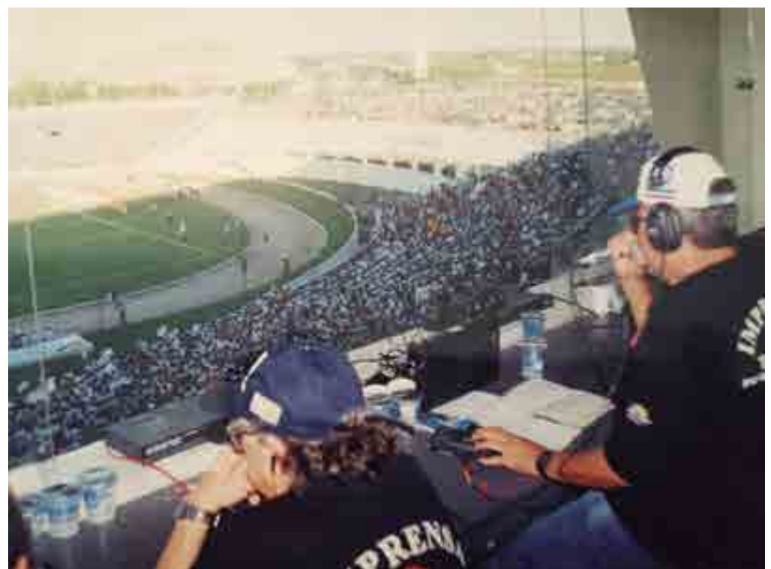
A Rádio Tabajara deu um banho de bola nas transmissões dos jogos da Copa dos Campeões no Estádio Almeidão

A segunda rodada foi no dia 27 de junho, com os mesmos jogos com o mando de campo invertido. No Almeidão, Sport 0x5 São Paulo e Coritiba 2x0 Corinthians. Já no