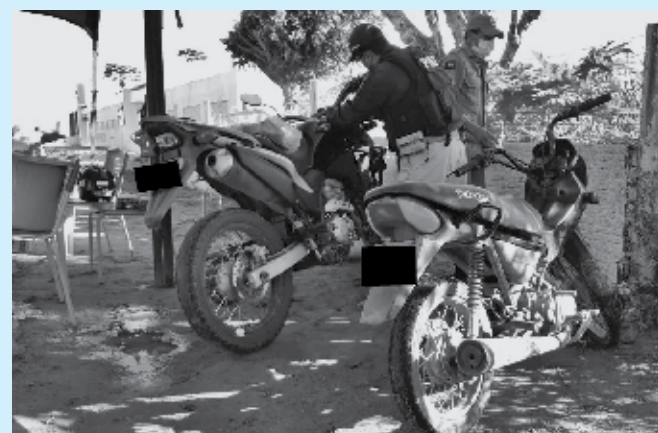
As motos foram apreendidas em barreira sanitária no Curimatá