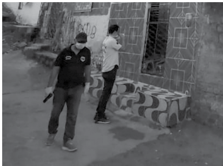
Em cumprimento aos mandados judiciais, os policiais cercaram ruas e estiveram nas casas dos investigados, onde encontraram materiais ilícitos

Em Alhandra, além das prisões houve a apreensão