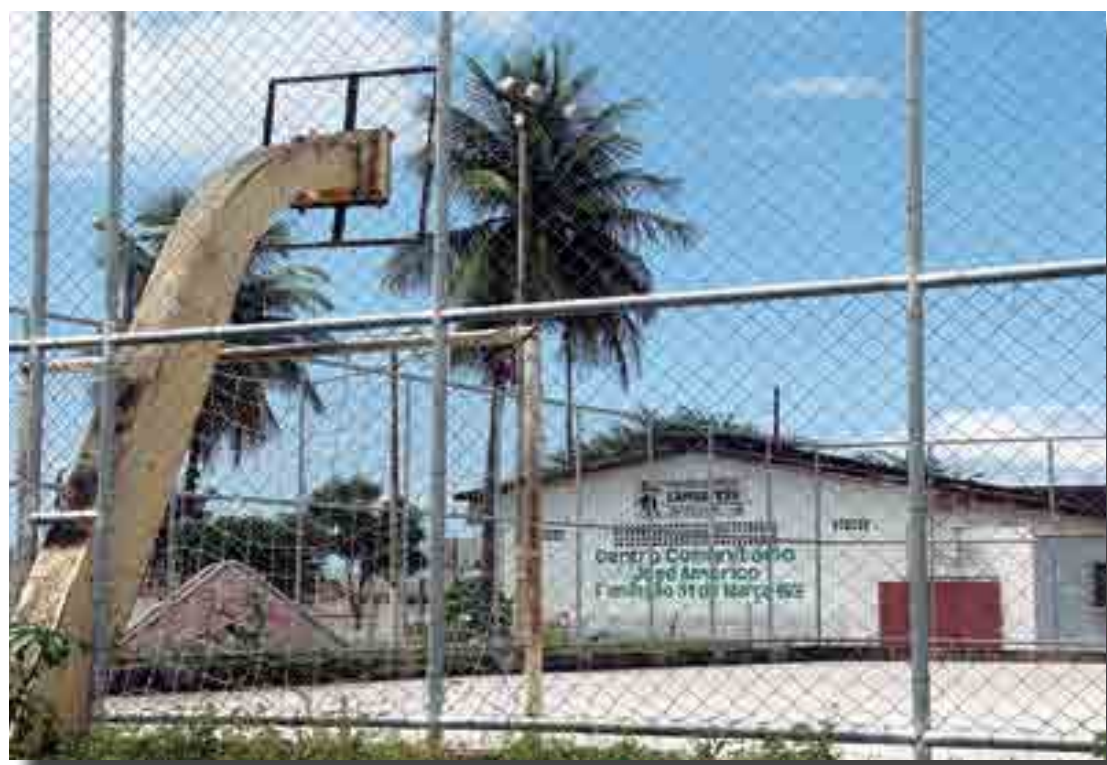
Bairro possui espaços de lazer, como praças com estrutura para prática de esportes, mas muitas áreas precisam ser restauradas

Com a expansão, o José Américo dispõe de Fórum Civil, grandes empresas e grandes redes de supermercados, uma usina de reciclagem de resíduos sólidos e uma Central de Abastecimento da Agricultura Familiar, onde os moradores têm condições de comprar frutas e verduras sem agrotóxicos.