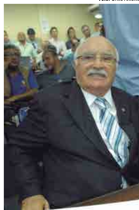
Ex-governador Wilson Braga faleceu no último domingo